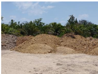
พื้นที่เก็บกองเปลือกดิน