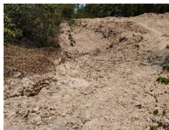
บ่อดักตะกอน