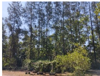
พื้นที่สีเขียวแนวป้องกันฝุ่น