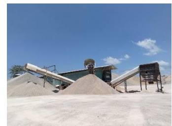
โรงแต่งแร่ บริษัท ตรัง ยูซี จำกัด