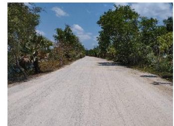
เส้นทางขนส่งแร่