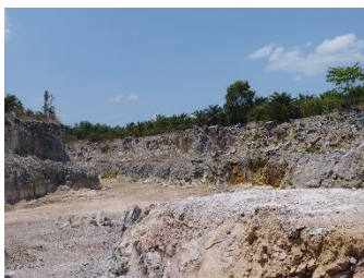
พื้นที่หน้าเหมืองปัจจุบัน